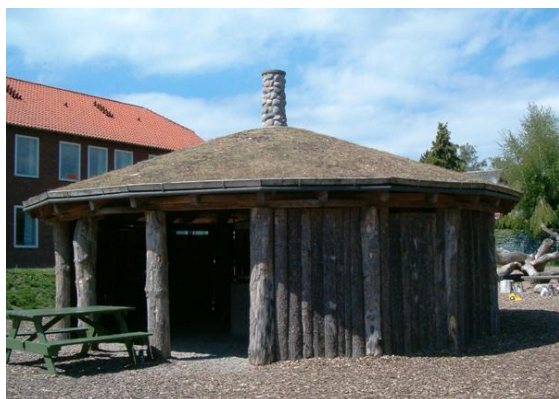
Billeder fra Horbelev Friskole. Ovenfor bålhytten. Højre spalte Domen.

Glæd jer til næste år. Vi planlægger hele fire kurser for grønne skoler til næste forår.