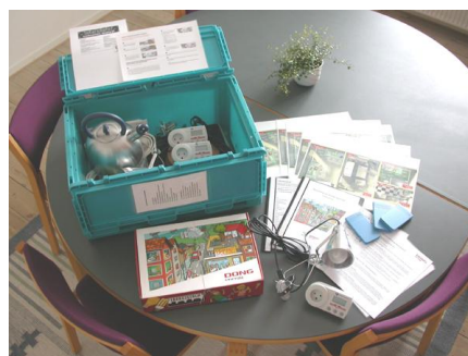
Temakassen til 4. – 5. klasse

Her er udover en lærervejledning med masser af gode ideer til undervisningen også praktiske materialer til energi-undervisningen: kogeplade, fløjtekedel, sparometre, energispil, lommeregner m.m. Læs mere sidst i dette nyhedsbrev.