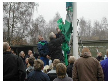
Nygård Skole, Helsingør

Skolen har lov til at flage med flaget i ét år. For at bevare flaget skal skolen gennemføre et nyt undervisningsprojekt hvert år.